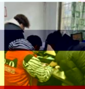
同学们在线下门店实训场景